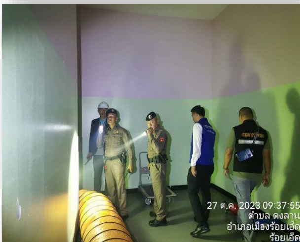
27 ต.ค. 2023 09:37:55 ตำบล ดงลาน อำเภอเมืองร้อยเอ็ด ร้อยเอ็ด