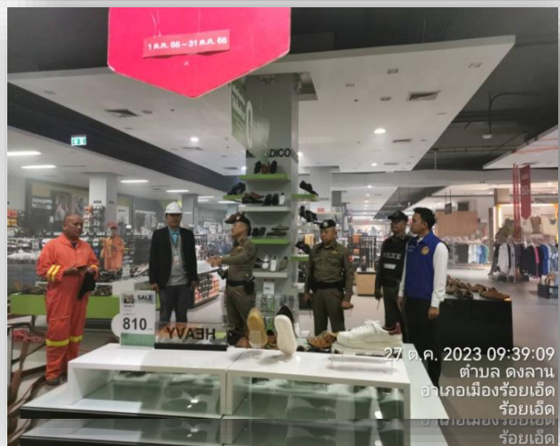
27 ต.ค. 2023 09:39:09 ตำบล ดงลาน อำเภอเมืองร้อยเอ็ด ร้อยเอ็ด ร้อยเอ็ด