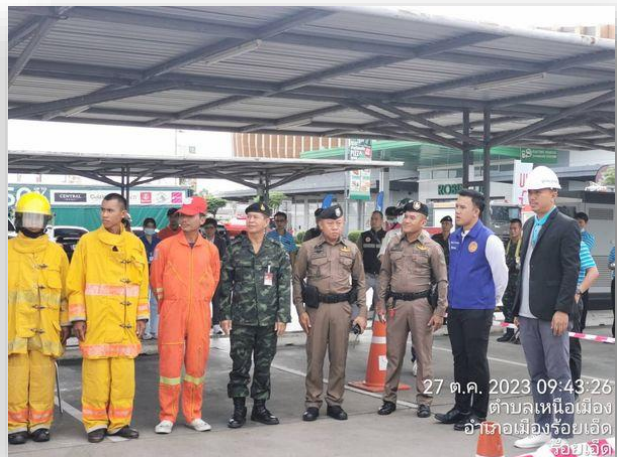
27 ต.ค. 2023 09:43:26 ตำบลเหนือเมือง อำเภอเมืองร้อยเอ็ด ร้อยเอ็ด